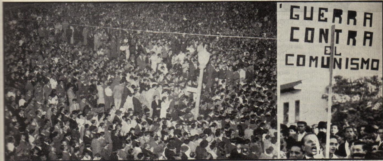
MANIFESTACION CATOLICA EN MEDELLIN (EL 10)

El pueblo de Barranquilla, en una caudalosa movilización cívica, desfiló, desde todos los barrios de la ciudad, hacia el Paseo de Bolívar, en la tarde